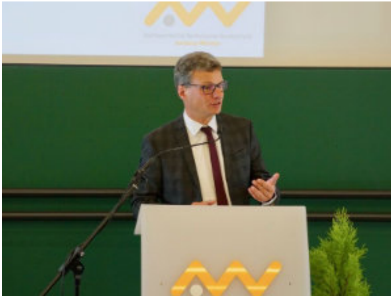
Herr Staatsminister für Unterricht und Kultus Bernd Sibler