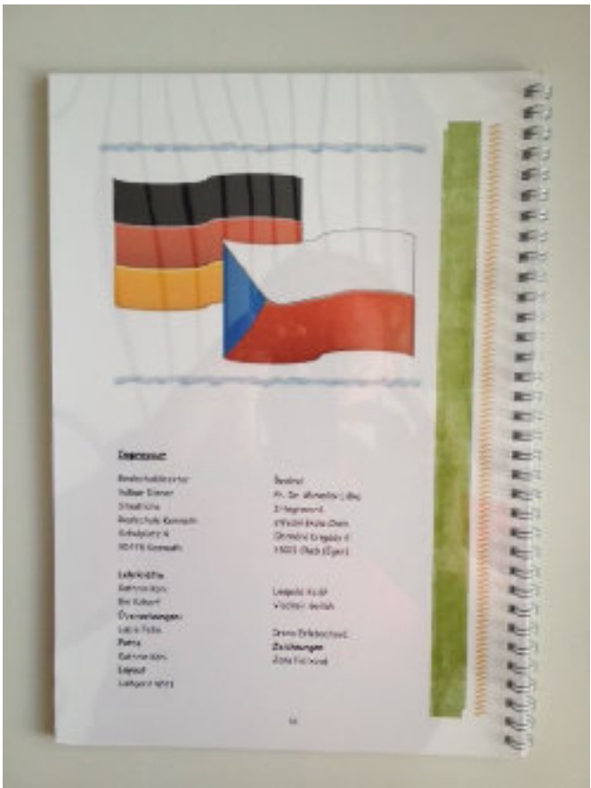
Herausgeber: Staatliche Realschule Kemnath